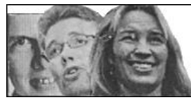
Magtens udøvere af : terrorlovene, rockerlovene & Murphys lov

Så kom det frem! Pol 27/4: Tempelbyggeriet på KUA er til teologi, jura & historie! Et skriftklog præsteskab til KU's stormagts-politiske satsning - Religion i det 21. århundrede - kom i hus! Læs mere i omløbsavisen a4 nr 1, 28/2-2002