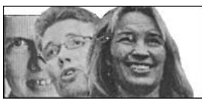
Et kongedømme – for et kys!