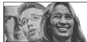
Et kongedømme – for et kys!