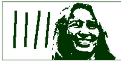
Det 8ende var en fejl og udgår

EN OMLØBS-AVIS nr 37 FRA BO NEUMANN årg 6 a4 nr 16, 20/12 2007