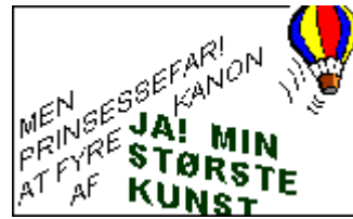
Loppen og Professoren